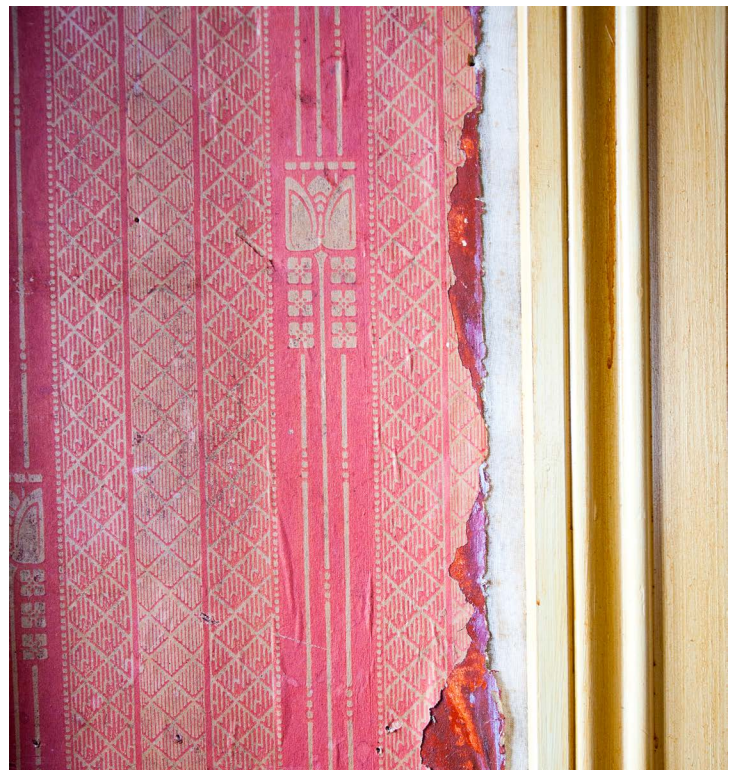
Detalj av det elegante jugendtapetet. Ved dørlisten kan man skimte litt av det enda eldre, håndmalte tapetet som ligger bakenfor.