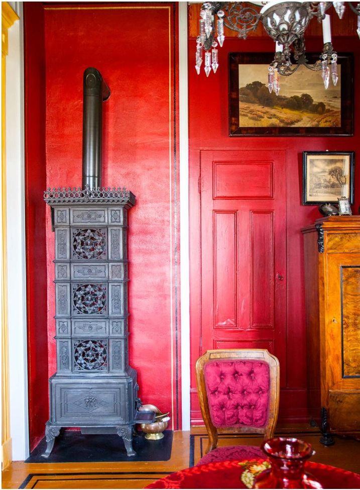
I salskabinettet er tilbakeført med delevegg og brannmur. En liten dør fører videre inn til anretningen. Gulvet er slipt forsiktig og malt opp.